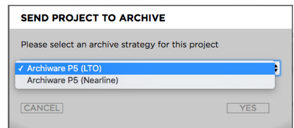
Archivierung aus der FlavourSys-Oberfläche

FlavourSys Strawberry ist ein preisgekröntes Production Asset Management (PAM), das dank moderner Technik das Teilen und die Verwaltung von Projekten auf zahlreichen Kreativ-Applikationen und Plattformen übernimmt. Die Philosophie hinter Strawberry ist, dass Benutzer weniger Zeit mit der Suche nach Material verbringen müssen und so den Fokus auf Inhalte und ihre kreative Arbeit setzen können. Ein Workflow-Tool, das den Kreativen hilft, Projekte und Assets zu erstellen, teilen und organisieren - mit einem ganz neuen Ansatz.